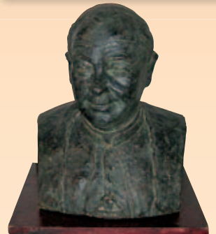
Buste van Mgr Bekkers

Het totaal aantal bezoekers vanaf de opening op tweede Paasdag tot en met de maand juni ligt op hetzelfde peil als in de overeenkomstige periode van het jaar 2009, n.l. 1365 nu en 1369 in 2009. Het groepsbezoek is iets toegenomen. De –afgelopen- hete zomer werkte niet in het voordeel van het museumbezoek, ondanks het feit dat het in de Antoniuskerk tijdens warme dagen zeer aangenaam vertoeven is. Slaat het weer om en wordt het buiten weer koud, dan blijft daar toch een weldadige warmte hangen. De belangstelling voor het Kerkenpadarrangement (Baak/Vierakker en Kranenburg) is tot dusver minder dan verwacht.